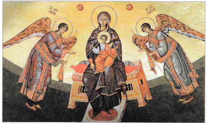
Maica Domnului, Împărăteasa Cerurilor

Cuvântul iubire denumește cel mai frumos sentiment pe care Dumnezeu ni l-a dăruit nouă, oamenilor, atunci când ne-a creat. El Însuși dovedește mereu o iubire nemărginită față de creația Sa, pe care o ocrotește: natura, plantele, animalele și, mai ales, pe noi, copiii Săi. Ca răspuns, suntem chemați să Îl iubim din tot sufletul pe Dumnezeu, Părintele ceresc, dar și pe semenii noștri.