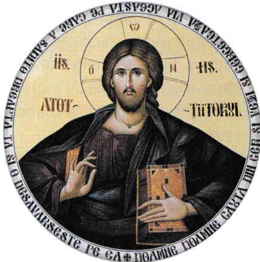
Domnul nostru Iisus Hristos, AtotŢiitorul

Dumnezeu ne-a creat și este Tatăl nostru din ceruri. El este plin de iubire părintească față de noi: ne ocrotește și ne ajută. De aceea, și noi, copiii Lui, Îl purtăm în minte și în suflet mereu.