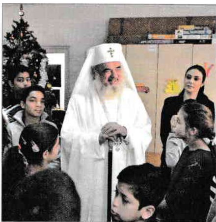
Vizită la un centru de zi

Sfântă Parascheva, roagă-te lui Dumnezeu pentru noi!