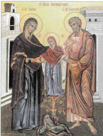
Sfinții Ioachim și Ana, părinții Maicii Domnului